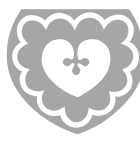
Vestre Slidre kommune