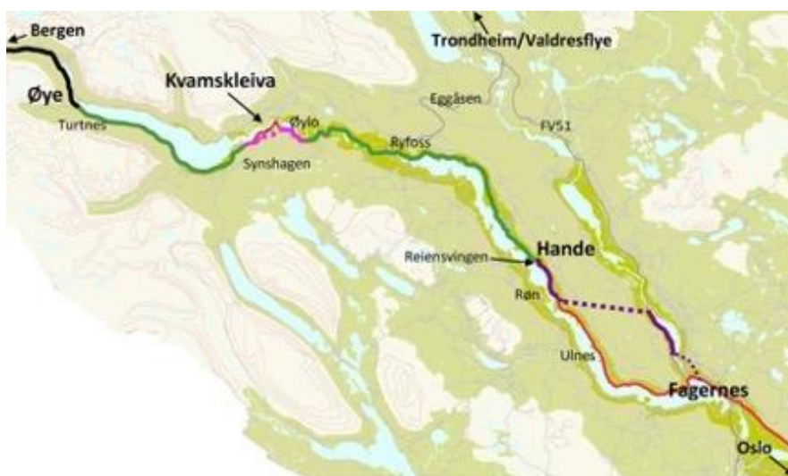
Kart: (Fagernes) Hande - Øye

Bruk av utbedringsmidler betyr en kraftig kostnadsbesparelse, som dog må søkes balansert mot for store nyttetap.