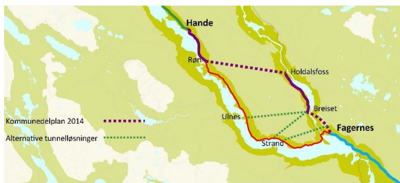
Kart: Fagernes S -Hande

FagernesS-Hande har sammen med Kvamskleiva i alle de siste NTP-periodene vært blant de høyest prioriterte prosjektene på hele E16 av såvel Stamvegutvalget som Oppland fylkeskommune.