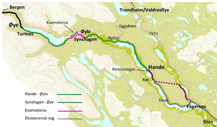
Kart: (Fagernes) Hande – Øye

I NTP 2018-29 er det lagt opp til at strekningen Fagernes-Øye skal finansieres med «strekningsvise utbedringsmidler», og i handlingsprogrammet for NTP 2018-23 er det avsatt en ramme på 400 mill.kr i «strekningsvise utbedringstiltak» i årene 2021-23. I tillegg vil disse midlene kunne suppleres med andre midler mv til et totalbeløp på ca 540 mill.kr. I statsbudsjettet for 2020 ble det bevilget en oppstartsbevilgning på 50 mill.kr. Bruk av utbedringsmidler betyr en kraftig kostnadsbesparelse, som dog må søkes balansert mot for store nyttetap.